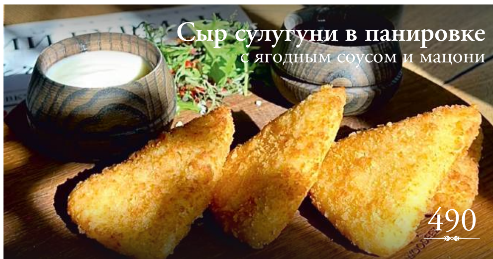
Сыр сулугуни в панировке с ягодным соусом и мацони