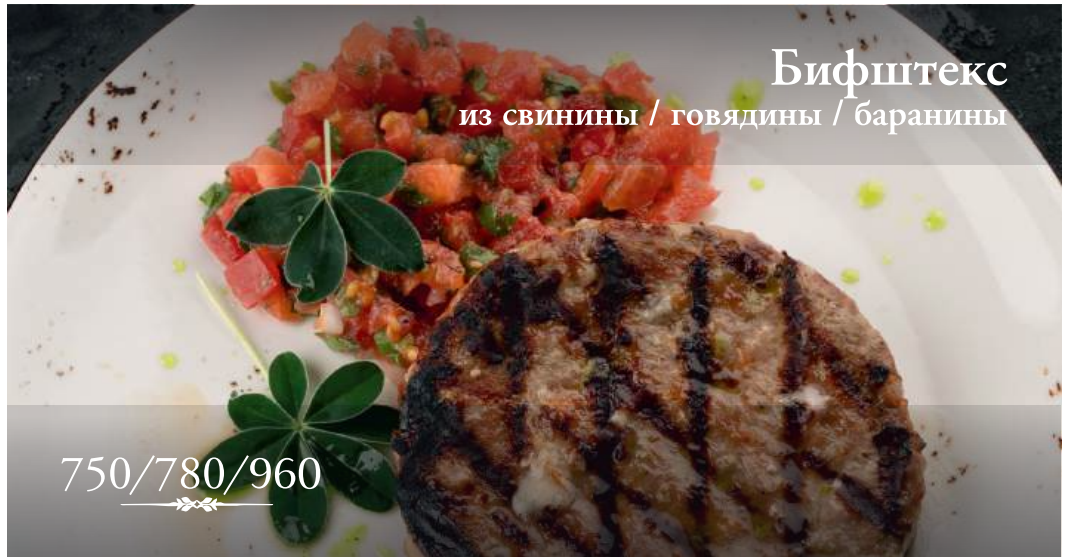
Бифштекс из свинины / говядины / баранины