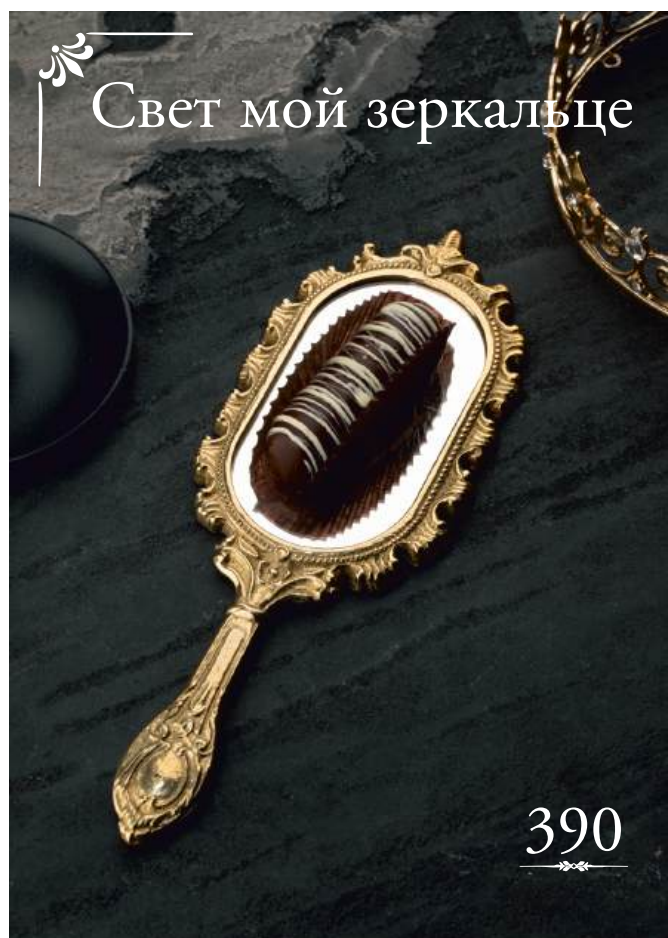
Свет мой зеркальце