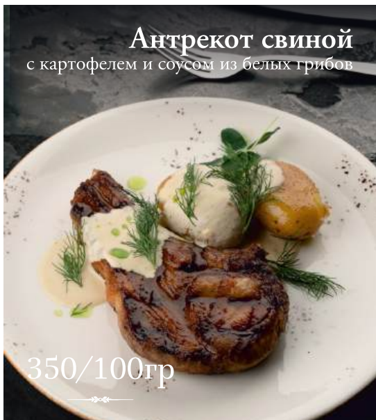
Антрекот свиной с картофелем и соусом из белых грибов