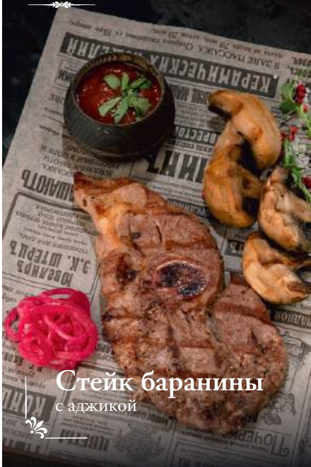
Стейк баранины с аджикой