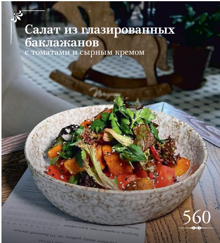
Салат из глазированных баклажанов с томатами и сырным кремом