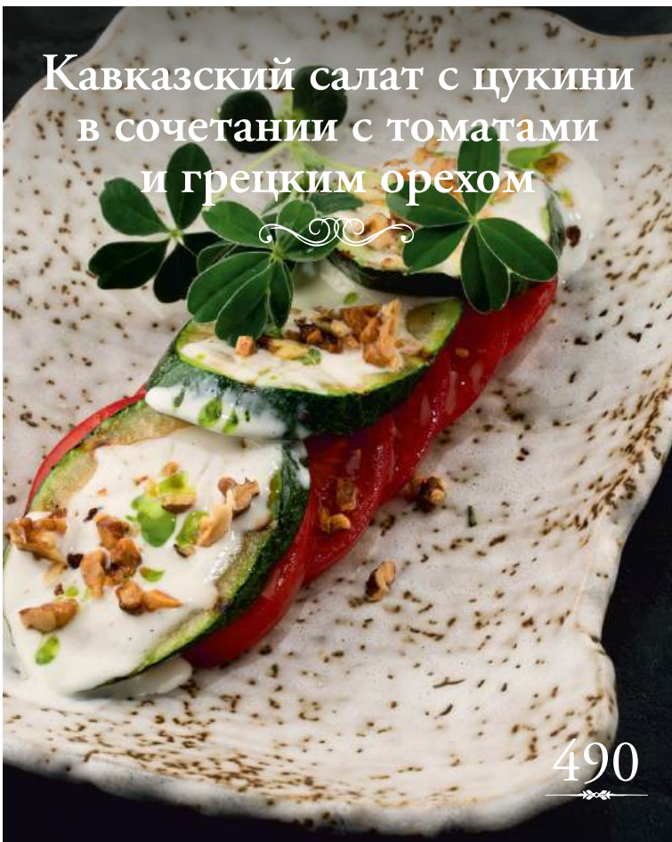
Кавказский салат с цуккини в сочетании с томатами и грецким орехом