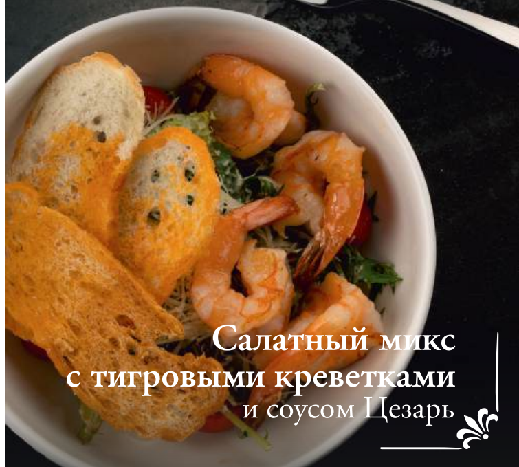
Салатный микс с тигровыми креветками и соусом Цезарь