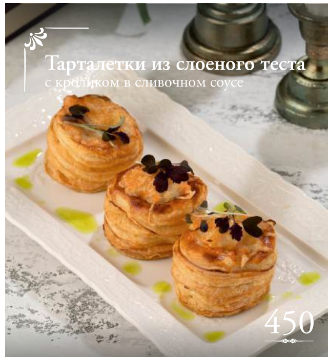
Тарталетки из слоеного теста с кроликом в сливочном соусе