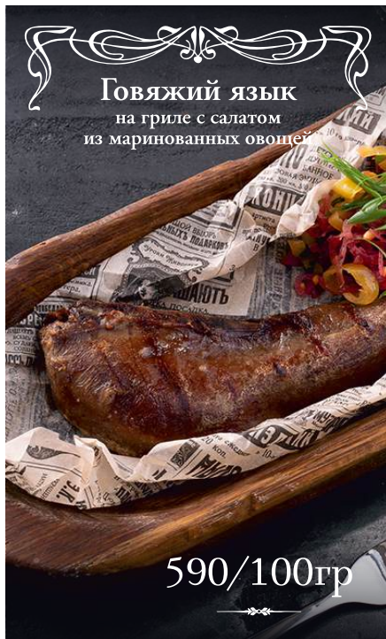
Говяжий язык на гриле с салатом из маринованных овощей