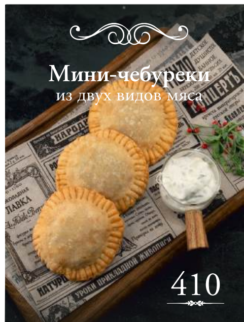
Мини-чебуреки из двух видов мяса