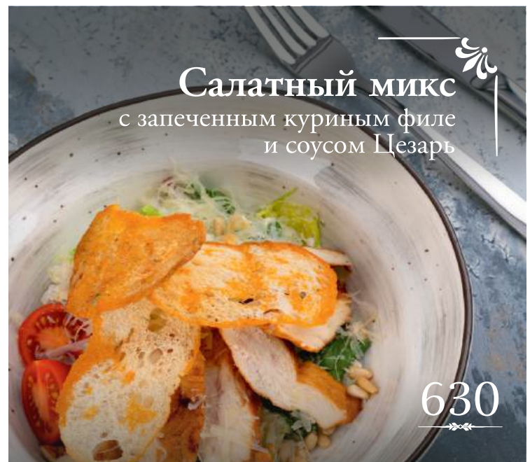
Салатный микс с запеченным куриным филе и соусом Цезарь