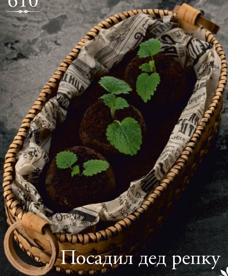
Посадил дед репку